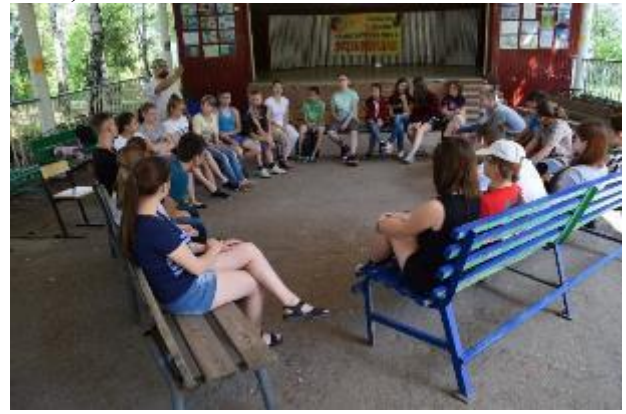
Психологический тренинг для педагогов и учащихся «Как преодолеть стресс» (бизнес-тренер, Самарский кадровый клуб А.А. Тополян)

Психологический тренинг для педагогов и ребят «Как преодолеть стресс» (бизнес-тренер, Самарский кадровый клуб А.А. Тополян) был направлен на объединение учащихся смены.