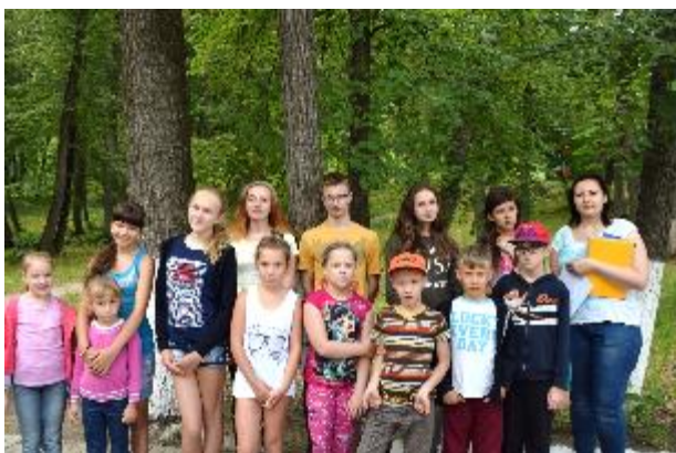
Отряд «Юные натуралисты» собирается на занятие