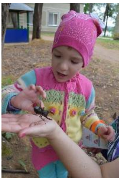
Самый юный участник смены рассматривает жука-носорога