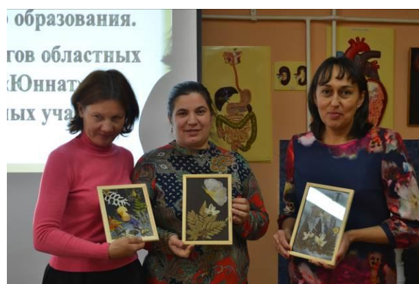
Участники мастер-класса по изготовлению флористических картин